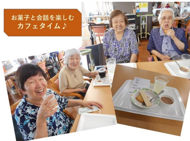
お菓子と会話を楽しむ カフェタイム♪